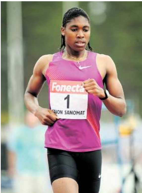
Caster Semenya tijdens een wedstrijd in Finland in juli 2010, kort na afloop van haar schorsing.